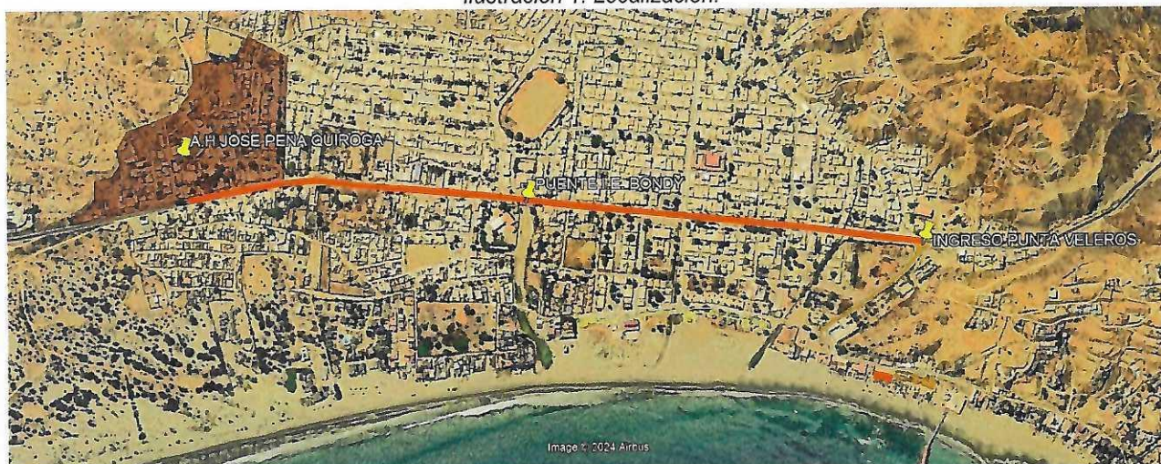
Ilustración 2. Ubicación del proyecto