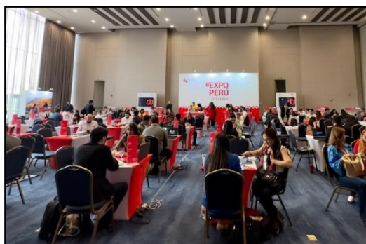
Imagen de referencia de distribución sala.