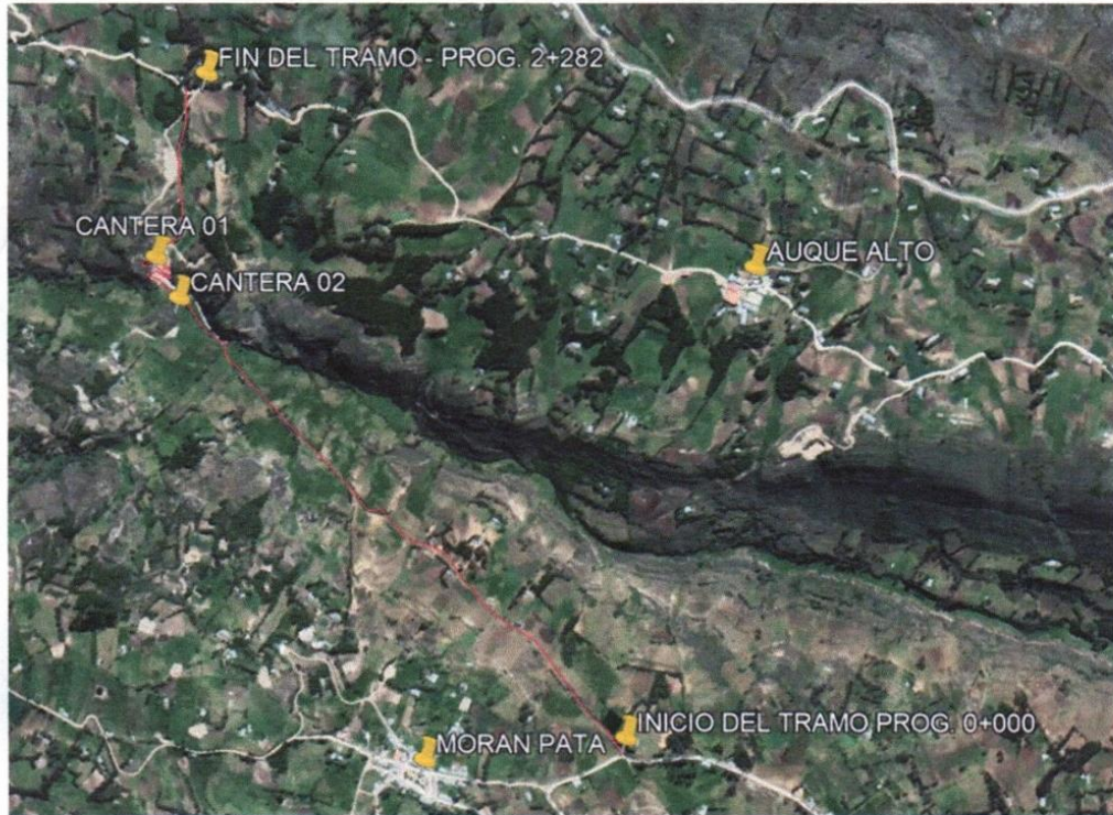
IMAGEN N° 02.

GRÁFICO N° 02: LOCALIZACIÓN DEL PROYECTO CROQUIS – PLANO DE UBICACIÓN