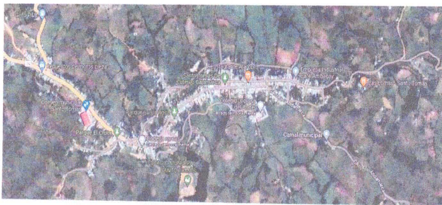
MAPA 4: LOCALIZACIÓN DE LOCALIDADES BENEFICIARIAS

REGION: Cajamarca PROVINCIA: Cutervo DISTRITO: Santo Tomas LOCALIDAD: Santo Tomas CALLE: El porvenir, La Primavera, José Gálvez, Cujillo, San Juan, Ambagay, Lima, Víctor Raúl, Chota, Súcota, Selva, Luis Ramirez, Los Pinos.