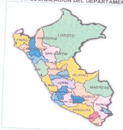
MAPA 01: LOCALIZACIÓN DEL DEPARTAMENTO

Dirección: Jirón Sucre N° 231 - Plaza de Armas - Santo Tomás