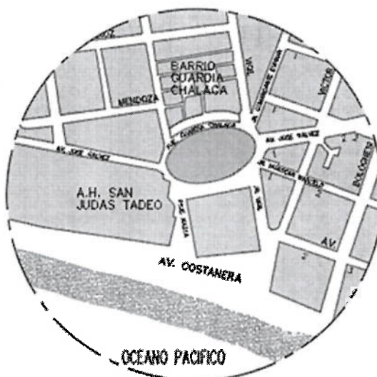
IMAGEN 02: UBICACIÓN DEL PROYECTO