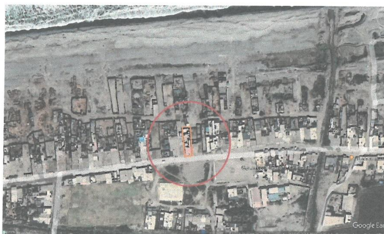
El área de influencia del proyecto está identificado en la ubicación del proyecto a ejecutar en el Centro Poblado Boca de Río