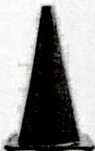
CONO DE SEGURIDAD