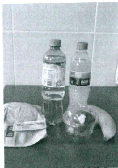
Imágenes referenciales del servicio

EL CONTRATISTA deberá presentar hasta los 20 días calendario posteriores a la suscripción del contrato, la programación de los refrigerios para la atención en las áreas de descanso de voluntarios, según corresponda, la misma que debe evidenciar el cumplimiento del requerimiento Kcal, para su revisión y aprobación por EL PROYECTO ESPECIAL.