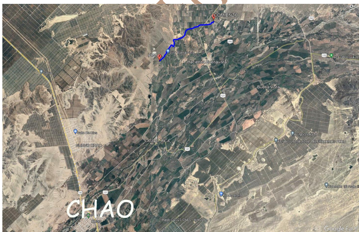
Figura N° 4: Esquema de Ubicación y Acceso a la zona a intervenir, desde Punto de Referencia (Centro del Distrito - Chao).