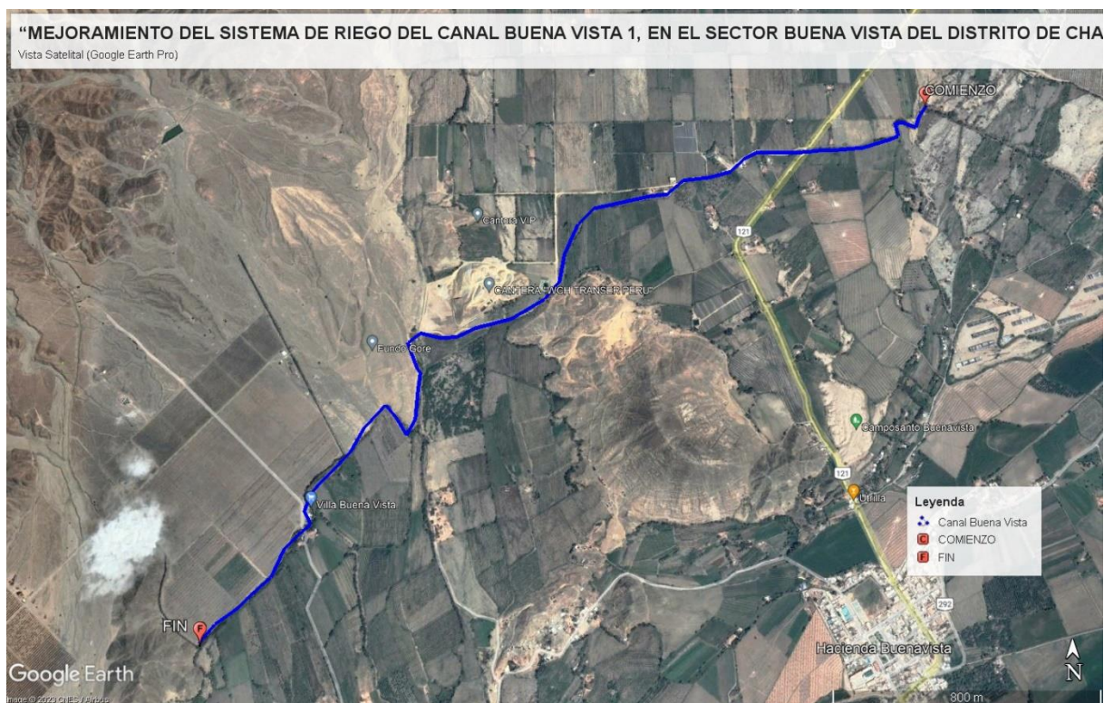
Figura N° 3: Esquema de Ubicación General