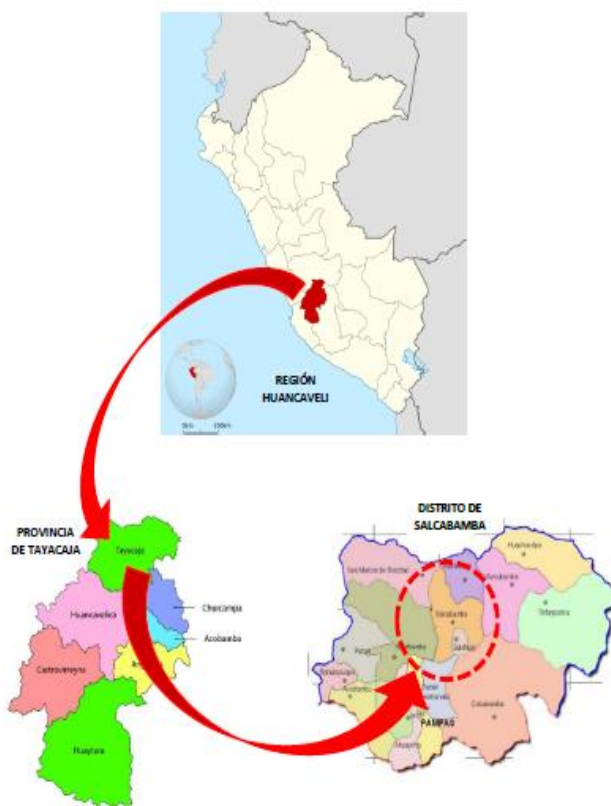
MACROLOCALIZACION DEL AREA DE INFLUENCIA-UBICACIÓN DEL DISTRITO DE SALCABAMBA