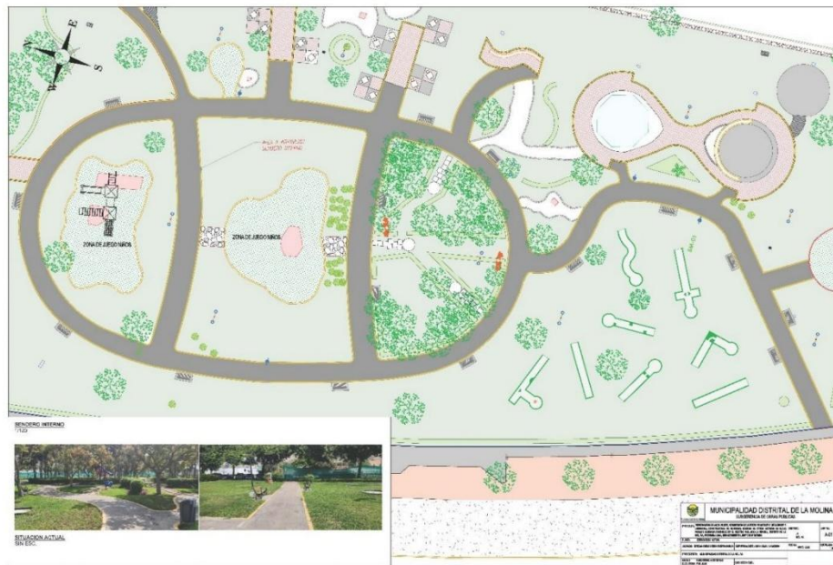
Figura 2: Localización

Av. Ricardo Elías Aparicio 740, La Molina Central Telefónica: (01) 313 4444 www.munimolina.gob.pe