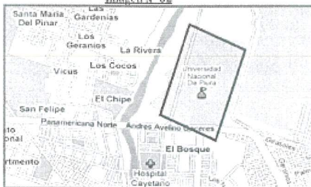
Imagen N° 02

La Universidad Nacional de Piura está ubicada en la Urb. Miraflores s/n, Castilla, Piura 295.