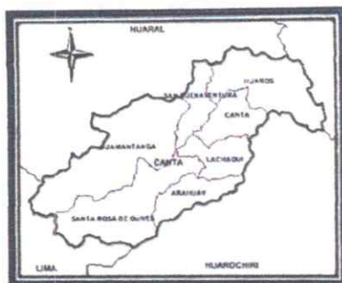
MAPA DE LA PROVINCIA DE CANTA