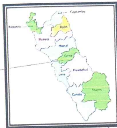
MAPA REGION DE LIMA