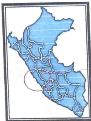
MAPA POLITICO DEL PERU

"Año del Bicentenario, de la consolidación de nuestra Independencia, y de la conmemoración de las heroicas batallas de Junín y Ayacucho"