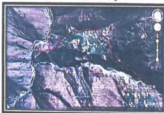
Imagen satelital de la ubicación del sistema de Riego Cotobamba.