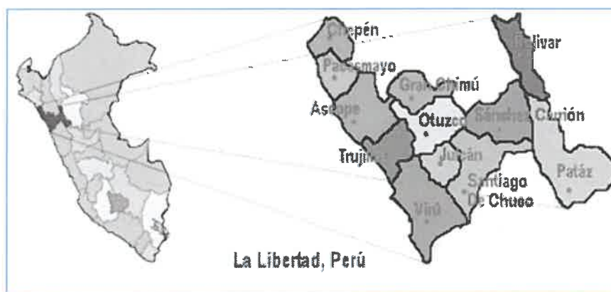
PAIS PERU: Región La Libertad