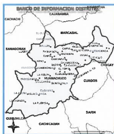
CIUDAD DE HUAMACHUCO