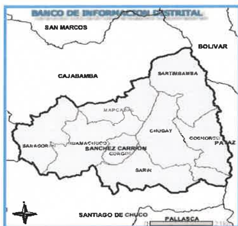
DISTRITO DE HUAMACHUCO