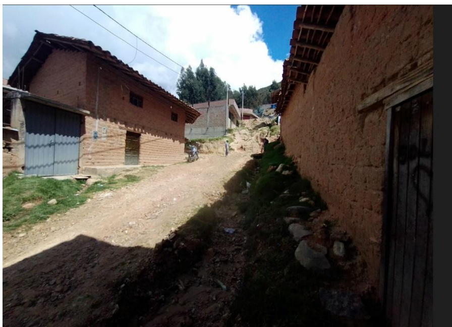
IMAGEN 1: Se puede observar que la entrada de la calle Las Congonas se encuentra en malas condiciones y necesitan una adecuada pavimentación con veredas y cunetas.