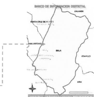
Imagen N° 01: