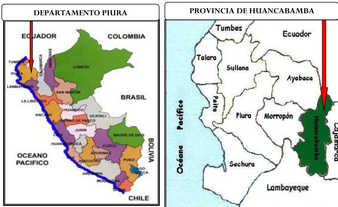
Ubicación del caserío Ulpamache – Rodríguez de Mendoza