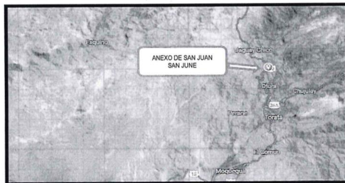
Foto 01, lugar de entrega de los bienes.

La entrega se realizará en almacén de obra, ubicado en el Anexo de San Juan San june del Distrito de Torata, Provincia Mariscal Nieto, Región Moquegua (carretera Torata – Omate).