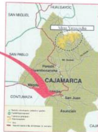
Imagen 01: Mapa de Ubicación del Proyecto