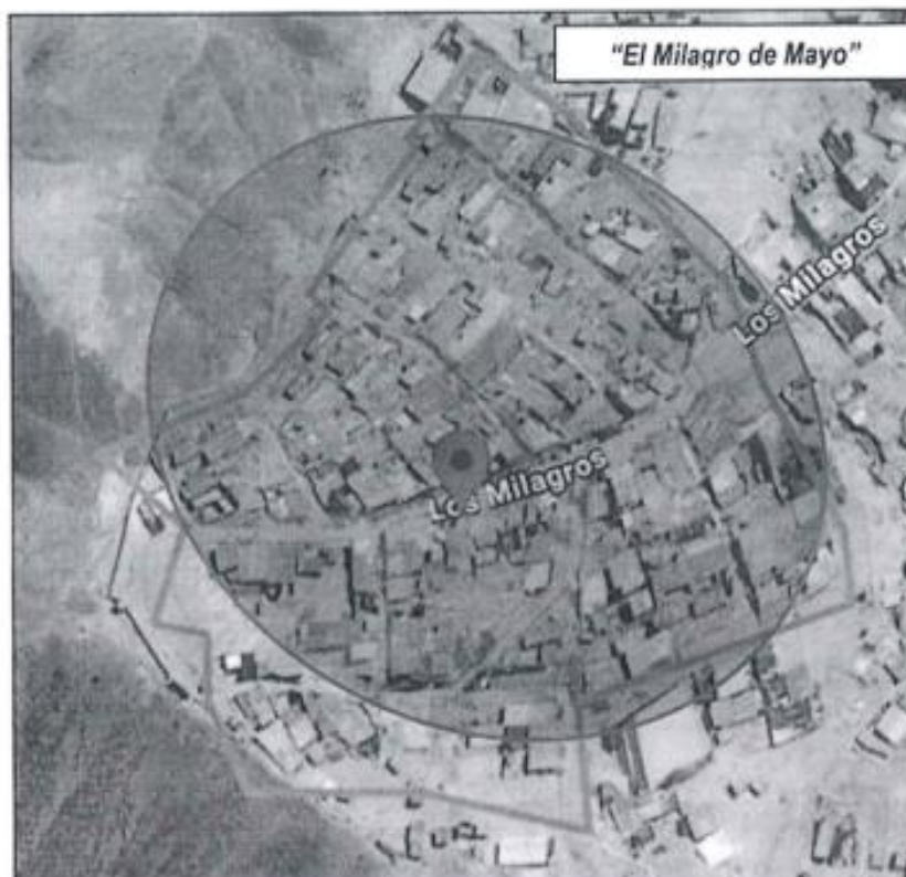
IMAGEN N° 1: Ubicación del terreno