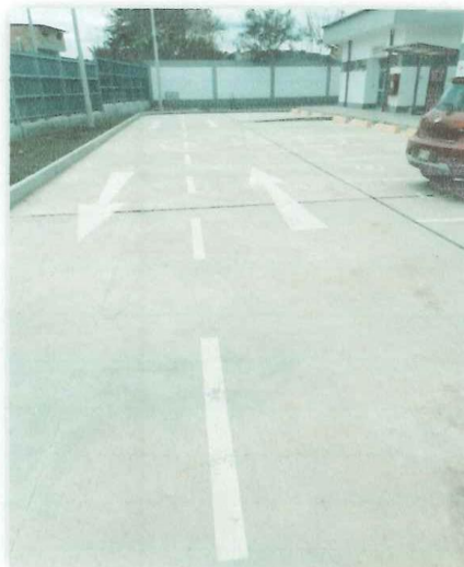
En la imagen tomada en Marzo de 2024, se puede apreciar el estado de la pintura en pavimento (señalética horizontal), que será repintado para el correcto flujo de vehículos dentro de las instalaciones.