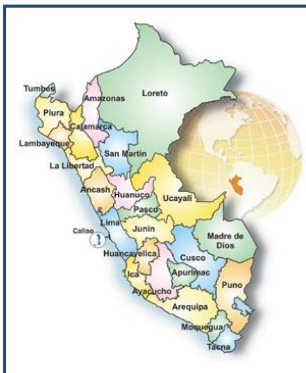
MAPA DEL PERÚ