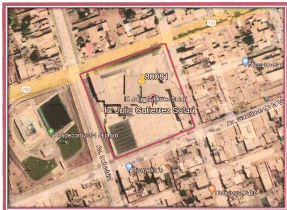
Imagen N°05: Imagen Satelital de la Zona del Proyecto

Arg. J. Neheli Ccoto Bardales SUBGERENTE DE ESTUDIOS Y PROYECTOS