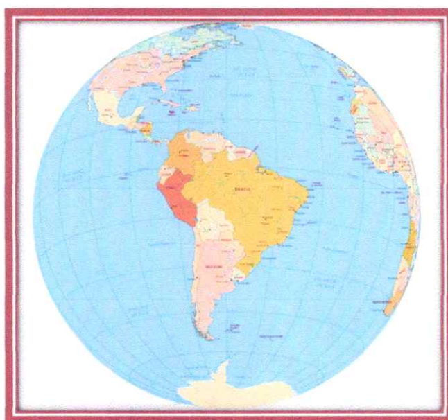
Imagen N°01: Mapa de América del Sur - Perú

País: Perú Región: La Libertad Provincia: Trujillo Distrito: Huanchaco Localidad: El Milagro Región Geográfica: Costa Altitud: 118.00 msnm Latitud Sur: 8° 51' 30.34.68" Latitud Oeste: 79° 3' 59.76" Ubigeo: 130104