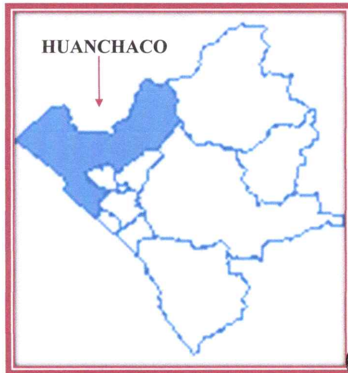
Imagen N°04: Mapa Distrital