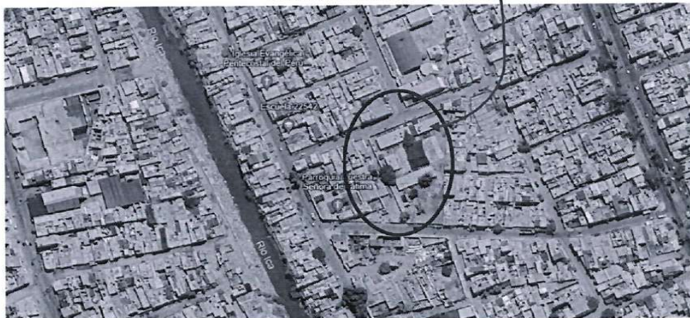
Ubicación de la I.E. N° 22542

La I.E. N° 22542 se encuentra ubicado en el Pueblo Joven Acomayo Zona "B" del distrito de Parcona, provincia de Ica, y ofrece a los habitantes de la zona el servicio de educación básica regular en el nivel de primaria, siendo polidocente completo. La institución educativa tiene como código modular 0564351 y código de local 212549.