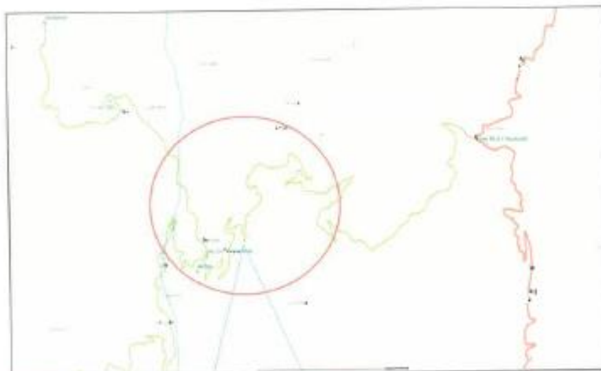
Camino Vecinal: Emp. Pe-3s F (Hatunhuaylla)-Parccotica (Km 12+017)