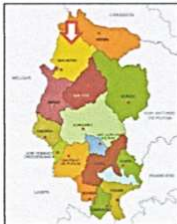
Mapa N° 82. UBICACIÓN PROVINCIAL DEL PROYECTO

La población beneficiaria es de 85 familias con 179 habitantes. Los pobladores de la Comunidad Campesina de Milluni se encuentran en situación de extrema pobreza con un bajo nivel de vida. Se tiene la carencia de muchísimas necesidades, entre ellas la infraestructura de abastecimiento de agua sistema de eliminación de excretas idóneo, los pobladores de la comunidad son bilingüe, hablándose el español y el quechua como lengua materna. (Se adjunta Resolución de Reconocimiento de Padrón de beneficiarios)