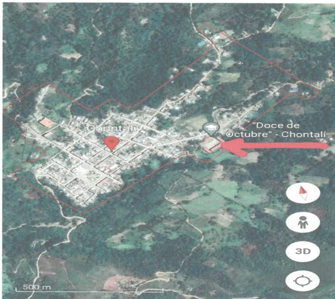
IMAGEN 01: UBICACION DEL PROYECTO