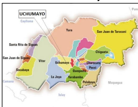
Figura N°4: Ubicación de la zona del proyecto y áreas de influencia en el Distrito de Uchumayo