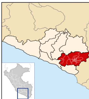
Figura N°3: Ubicación del Distrito de Uchumayo en la Provincia de Arequipa