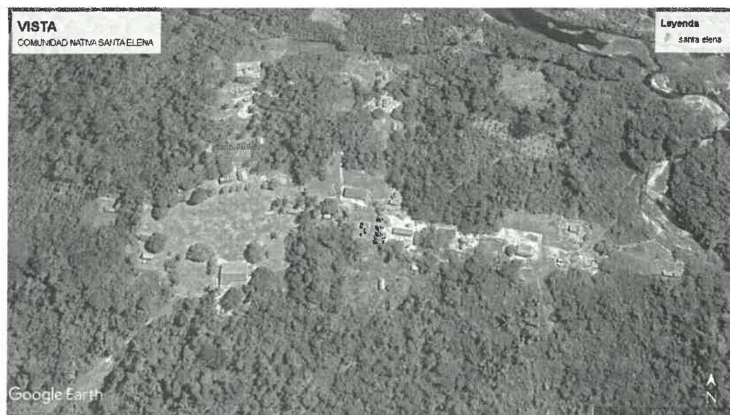
Figura 2: Vista satelital de la comunidad nativa santa elena.

Para llegar al presente proyecto, el acceso es desde la ciudad de Atalaya es por medio del río Tambo aguas abajo hasta el encuentro con el río Ucayali, en donde se continúa con el viaje aguas abajo hasta llegar a la C.N. SANTA ELENA DE YANAYACU, ubicado en el margen derecho del río Ucayali. El proyecto está hacia el Norte de la ciudad de Atalaya, distrito de Raimondi. Todo el trayecto dura 7 hora aproximadamente, en botes colectivos de 20 toneladas de capacidad y furgonetas, donde pueden desembarcar los materiales.