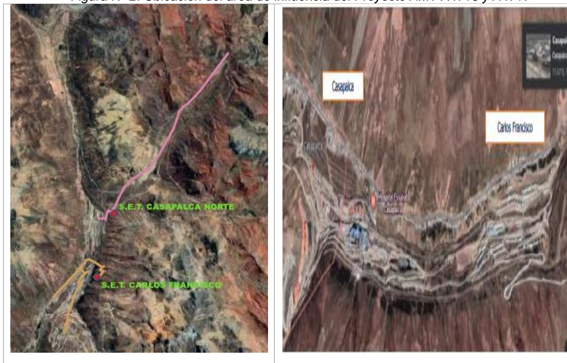
Figura N° 3: Ubicación de áreas específicas del Proyecto