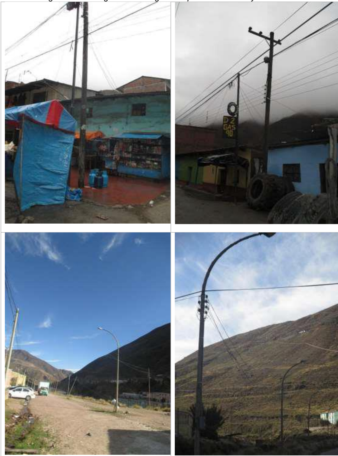
Figura N° 4: Fotografías del diagnóstico preliminar del Proyecto

Se puede apreciar muchas estructuras como esta en el AMT 4716 Y A4717 existente, los cuales requieren su mejoramiento, por haber cumplido su vida útil o incumplimiento de DMS