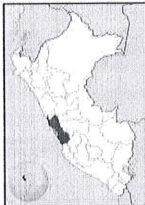
UBICACIÓN GEOGRÁFICA DEL DEPARTAMENTO DE LIMA

Región : Lima Departamento : Lima Provincia : Lima Distrito : Comas