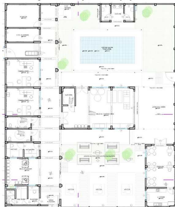
Figura 1. Planta primer nivel propuesta