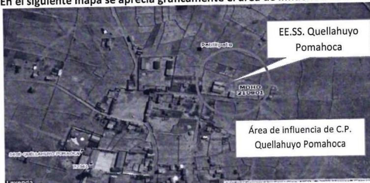
Cuadro N° 6: Acceso al área de influencia

En el siguiente mapa se aprecia gráficamente el área de influencia de EE.SS.