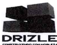
ANEXO N° 8 EXPERIENCIA DEL POSTOR

A FOLIO 6 Y 7 DE LA OFERTA PRESENTADA POR EL POSTOR DRIZLE S.A.C , CON R.U.C. N° 20601695147, SE IDENTIFICA EL ANEXO N° 08 – EXPERIENCIA DEL POSTOR EN LA ESPECIALIDAD, EL CUAL CONTIENE UN CUADRO CON EL RESUMEN DE LAS CONTRATACIONES DECLARADAS POR DICHO POSTOR PARA ACREDITAR EL REQUISITO DE CALIFICACION, CONSIGNANDO UN MONTO TOTAL FACTURADO DE S/ 2,511,587.71 (DOS MILLONES QUINIENTOS ONCE MIL QUINIENTOS OCHENTA Y SIETE CON 71/100 SOLES) DE UN TOTAL DE DIECISEIS (16) CONTRATACION, SIN EMBARGO NO ESTAN REFERIDAS A LOS SERVICIOS SIMILARES EXIGIDO EN LAS BASES INTEGRADAS: SERVICIOS DE MANTENIMIENTO DE LOCAL COMUNAL Y/O LOCAL MULTIUSOS Y/O LOCAL MUNICIPAL , TAL COMO SE REPRODUCE A CONTINUACION: