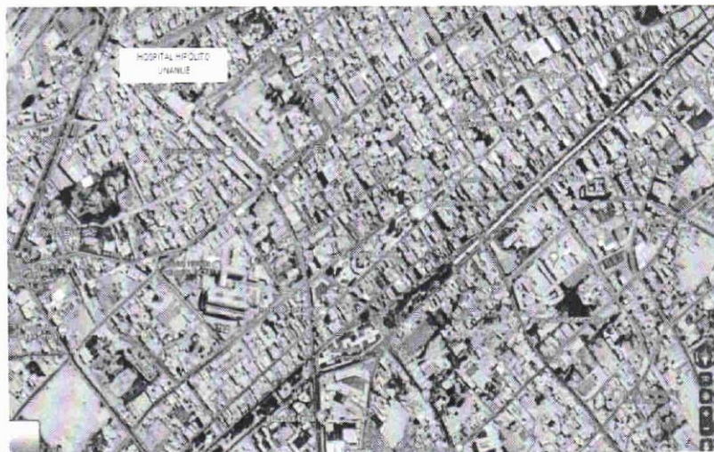
IMAGEN N° 2: CROQUIS DE LOCALIZACIÓN

Año del Bicentenario, de la consolidación de nuestra Independencia, y de la conmemoración de las heroicas batallas de Junín y Ayacucho"