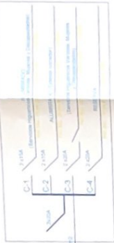
DIAGRAMA UNIFILAR TD-1