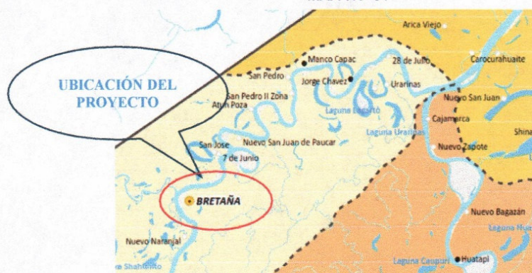
MAPA N° 01