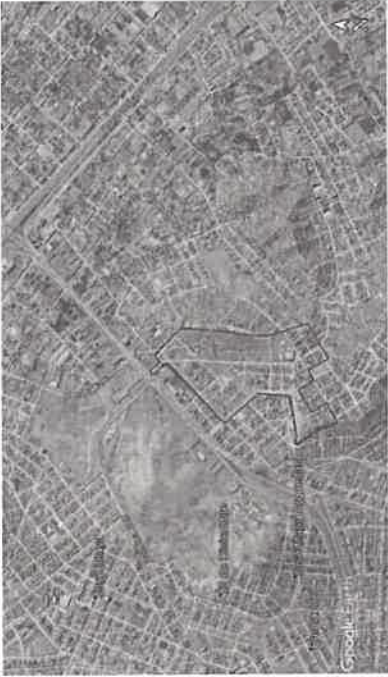
Imagen N.º 10-1: Mapa de Ubicación A.H. VILLA ESCUDERO