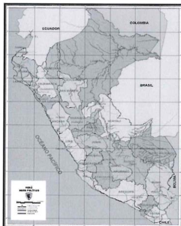
MAPA POLÍTICO DEL PERÚ