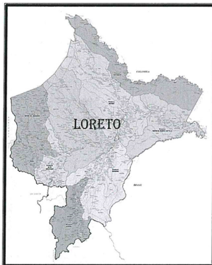
Gráfico de Localización del Proyecto, localización dentro del distrito

"Año del Bicentenario, de la consolidación de nuestra Independencia, y de la conmemoración de las heroicas batallas de Junín y Ayacucho"