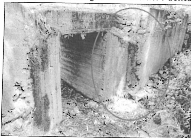
Ilustración 2 Estribo de margen derecho del Puente Ichupata