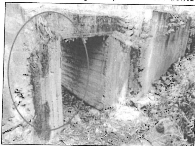
Ilustración 3 Estribo de margen izquierdo del Puente Ichupata