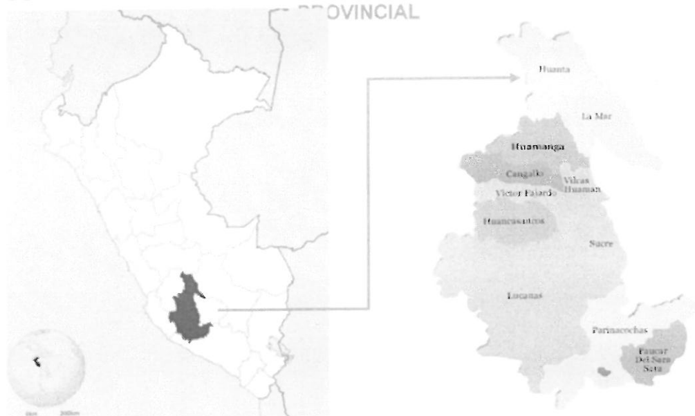
Ilustración 1 Ubicación Departamental - Provincial – Distrital