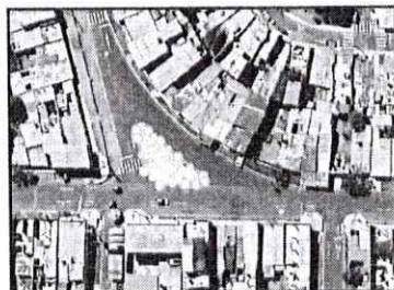
Figura 01. Ubicación del Servicio de la Actividad.