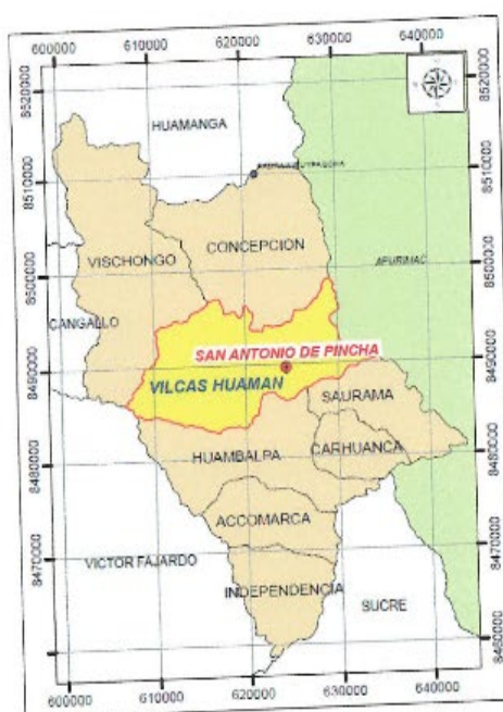
Mapa N°2: Ubicación Distrital.