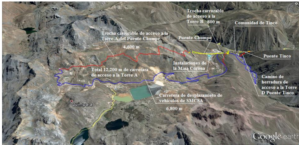
Figura 1. Ubicación de la zona del Proyecto.

El servicio será desarrollado en las oficinas del Consultor. Cuando sean necesarias reuniones de coordinación, estas se realizarán de manera virtual, a través de la plataforma indicada por el Administrador del Contrato.