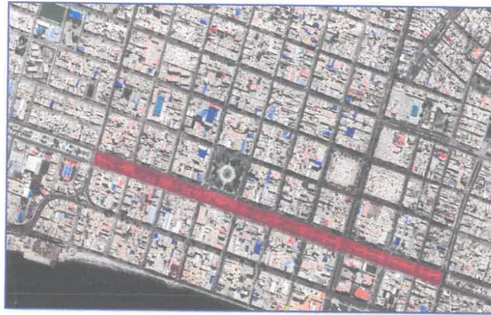
PLANO DE UBICACIÓN ESCALA 1:1000 PLANO DE LOCALIZACIÓN ESCALA 1:15000 LEGENDA ÁREA A INTERVENIR MUNICIPALIDAD PROVINCIAL DEL A. N. T. A. ELIMINACIÓN Y LOCALIZACIÓN SUB DIVISIÓN DE PROYECTOS Y ESTUDIOS TÉCNICOS UL-01