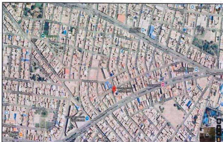
Ilustración 1: Ubicación de la I.E. (Maps)