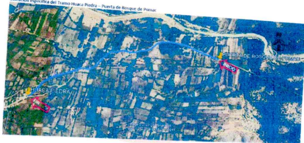
IMAGEN N°01. TRAZO DEL TRAMO HUACA DE PIEDRA – BOSQUE DE POMAC

Ubicación específica del Tramo Huaca Piedra – Puerta de Bosque de Pomac