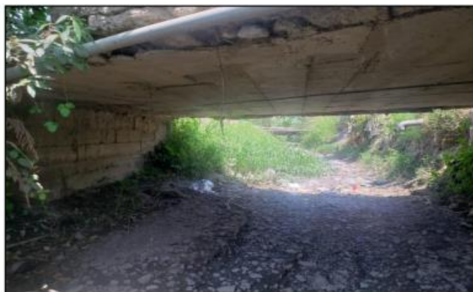
Imagen N° 02: Visualización de Curvatura en Falla Estructural por Flexión en Tablero Losa del Pontón Existente del Sector La Planta, Distrito de Paiján.

Imagen N° 01: Vista del Resquebrajamiento del Concreto del Tablero Losa del Pontón, lo que genera la exposición, y, por ende, corrosión del Acero de Refuerzo en la Estructura.