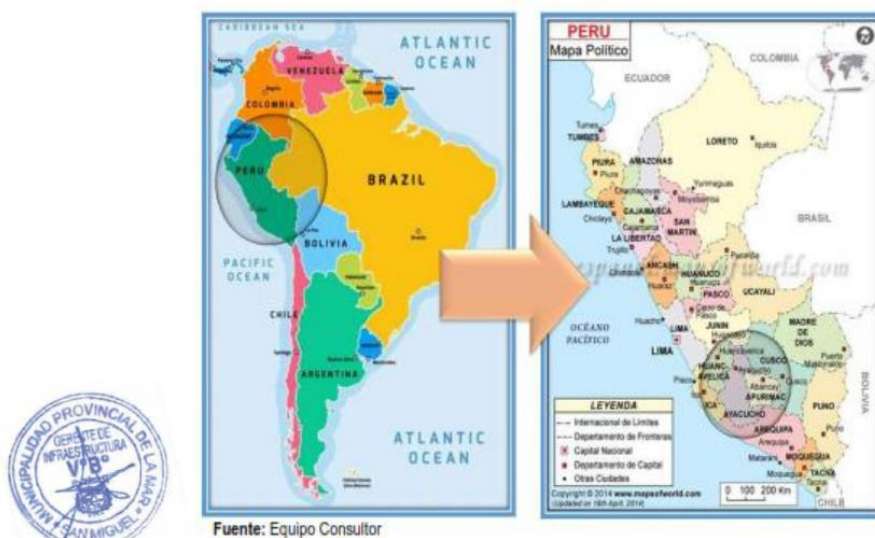
FIGURA N° 02 - MAPA DE UBICACIÓN REGIONAL Y PROVINCIAL