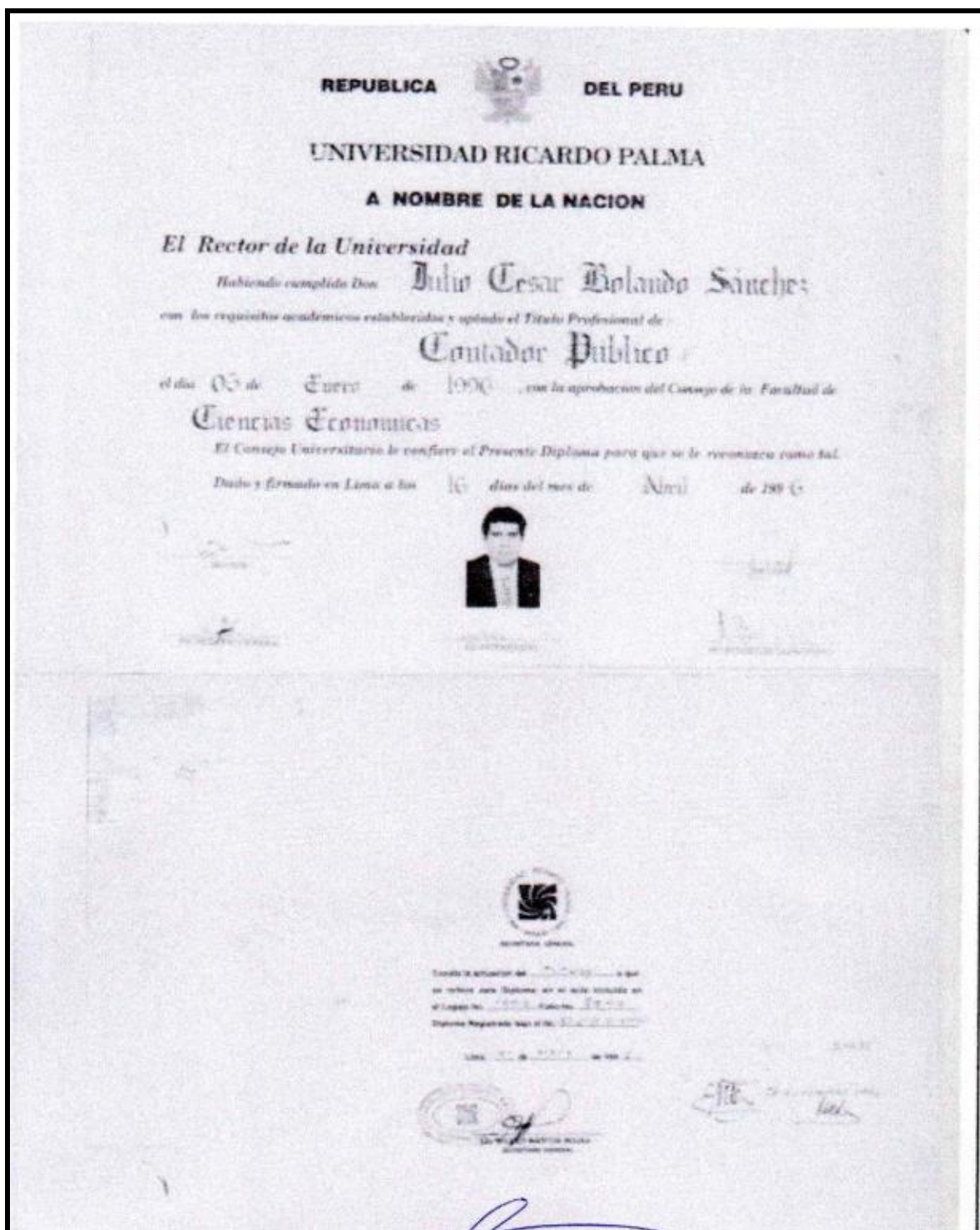
IMAGEN EXTRAIDA DE LA OFERTA DEL POSTOR REYES RAMIREZ JEAN PIERRE ANTONIO (FOLIO 25):